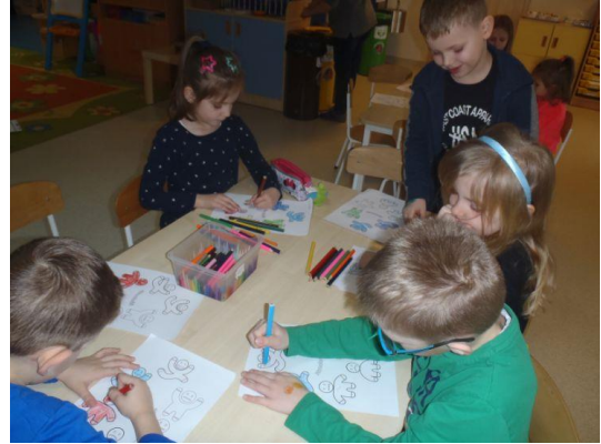
Zdjęcia z zajęć w Przedszkolu „Srebrna Kotwica” w Gdańsku.

Realizacja zadania umożliwiła ciągły dostęp społeczeństwa do informacji o jakości powietrza na stronach internetowych https://armaag.gda.pl/ i https://airpomerania.pl/ oraz na krajowym portalu jakości powietrza http://powietrze.gios.gov.pl/pjp/current i Komisji Europejskiej http://airindex.eea.europa.eu/ .